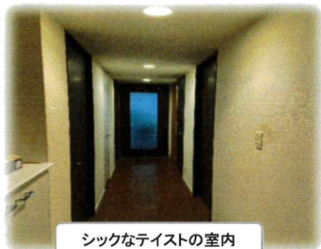
シックなテイストの室内