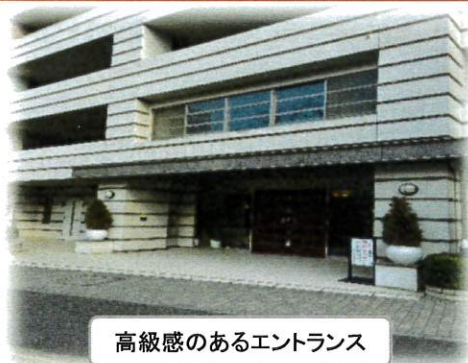
高級感のあるエントランス