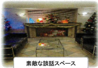
素敵な談話スペース